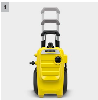
1 Asa telescópica