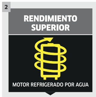
2 Motor refrigerado por agua y potencia sobresaliente