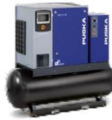
Ready RTA D 20 - 500 VF