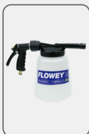
60006 Foam Gun 2,8L