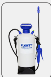
50054-10C Sprayer 10L