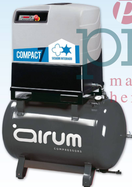
COMPACT 7-270 ES

Airum 10 hp caldera 270 lts. 1000 lts./min. 400V III 10 bar. 67 dB(A)