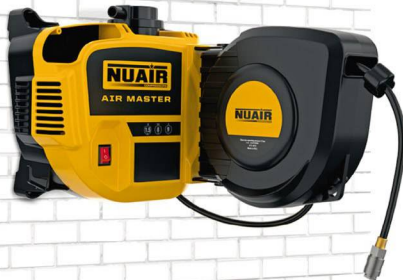
AIR MASTER 1.5 hp sin caldera. 160 lts./min. 230VII 8 bar. Sin aceite. 69 dB(A). Enrollador con 9 mts. de manguera.