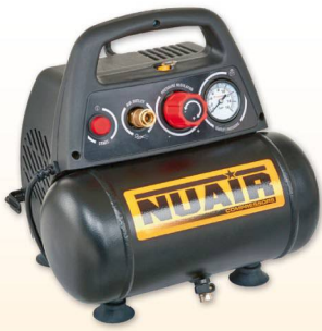
NEW VENTO 200/8/6 Nuair 1.5 hp caldera 6 lts. 180 lts./min. 8 bar. Sin aceite.