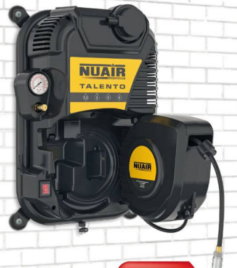
TALENTO 1.5 hp. Caldera 2 lts. 160 lts./min. 230VII 8 bar. Sin aceite. 69 dB(A). Enrollador con 9 mts. de manguera.