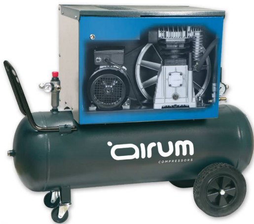
SILBOX B3800/100 CM3

Airum 3 hp caldera 100 lts. 390 lts./min. 220V II 10 bar. 69 dB(A).