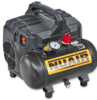
SILTEK + Nuair 1 hp caldera 6 lts. 105 lts./min. 59dB(A) 8 bar. Sin aceite.